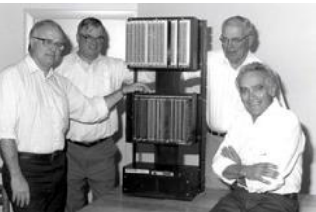
Modicon 084, primul PLC

A doua revoluție industrială a debutat la sfârșitul secolului XIX. Începând cu prima parte a secolului XIX, descoperirile și invențiile din domeniul electricității și mașinilor electrice au avut o dinamică fulminantă. Acest lucru a făcut ca, spre sfârșitul acestui secol, motorul electric să fie utilizat în industrie. Pe de altă parte, necesitatea tot mai mare de produse a făcut ca fabricile să crească continuu, ceea ce solicita modalități de organizare a producției diferite de cele ale fabricilor/atelierelor de la începutul secolului. Specific acestei revoluții este utilizarea acționării electrice a echipamentelor de producție și realizarea unei producții de masă bazată pe divizarea și specializarea activităților în procesul muncii prin utilizarea liniilor de producție. Prima linie de producție a fost utilizată în anul 1870 la abatorul din Cincinnati, SUA. Dar cea mai cunoscută și cu impactul cel mai mare l-a avut introducerea de către Ford, în anul 1913, a liniei de montaj pentru modelul de automobil Ford T. Dacă în anul 1912 producția de automobile Ford T era de 40.000 de bucăți, în anul 1914, după introducerea liniei de montaj, aceasta a crescut la peste 260.000. O altă caracteristică a acestei revoluții a fost dezvoltarea motorului cu ardere internă care a revoluționat transporturile și a deschis era utilizării petrolului ca principală sursă de energie.