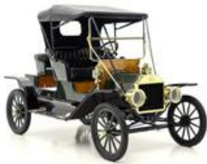
Automobil Ford T din anul 1912

A doua revoluție industrială a debutat la sfârșitul secolului XIX. Începând cu prima parte a secolului XIX, descoperirile și invențiile din domeniul electricității și mașinilor electrice au avut o dinamică fulminantă. Acest lucru a făcut ca, spre sfârșitul acestui secol, motorul electric să fie utilizat în industrie. Pe de altă parte, necesitatea tot mai mare de produse a făcut ca fabricile să crească continuu, ceea ce solicita modalități de organizare a producției diferite de cele ale fabricilor/atelierelor de la începutul secolului. Specific acestei revoluții este utilizarea acționării electrice a echipamentelor de producție și realizarea unei producții de masă bazată pe divizarea și specializarea activităților în procesul muncii prin utilizarea liniilor de producție. Prima linie de producție a fost utilizată în anul 1870 la abatorul din Cincinnati, SUA. Dar cea mai cunoscută și cu impactul cel mai mare l-a avut introducerea de către Ford, în anul 1913, a liniei de montaj pentru modelul de automobil Ford T. Dacă în anul 1912 producția de automobile Ford T era de 40.000 de bucăți, în anul 1914, după introducerea liniei de montaj, aceasta a crescut la peste 260.000. O altă caracteristică a acestei revoluții a fost dezvoltarea motorului cu ardere internă care a revoluționat transporturile și a deschis era utilizării petrolului ca principală sursă de energie.