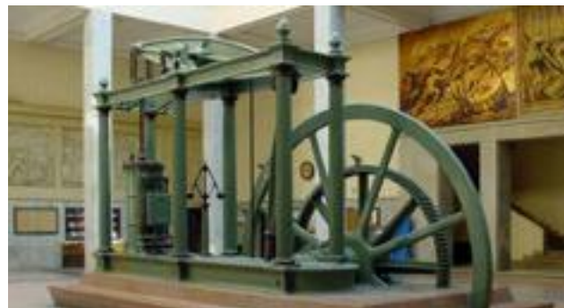
Mașina cu abur a lui James Watt

Impactul tehnic a provocat o puternică impulsivitate în domeniul invențiilor, apar fabrici, uzine, iar munca manuală se înlocuiește cu cea mecanizată. O importantă invenție a fost făcută în anul 1760, când James Watt a inventat motorul cu aburi, care a început să fie utilizat în diferite ramuri ale industriei. Inventatorul și inginerul englez George Stephenson construiește prima cale ferată, iar în anul 1829 locomotiva „Racheta”, care este considerată prima locomotivă rentabilă folosită ca mijloc de tracțiune pe calea ferată.