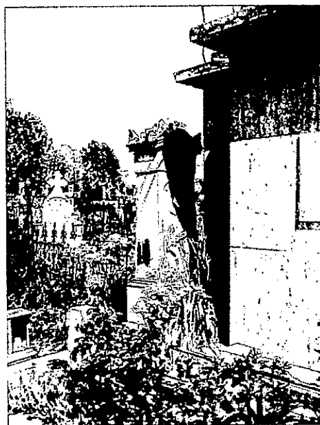
Cimitirul Sudic Focșani

Efecte ale îndeșirii necontrolate și ale abandonului prin dispariția urmașilor